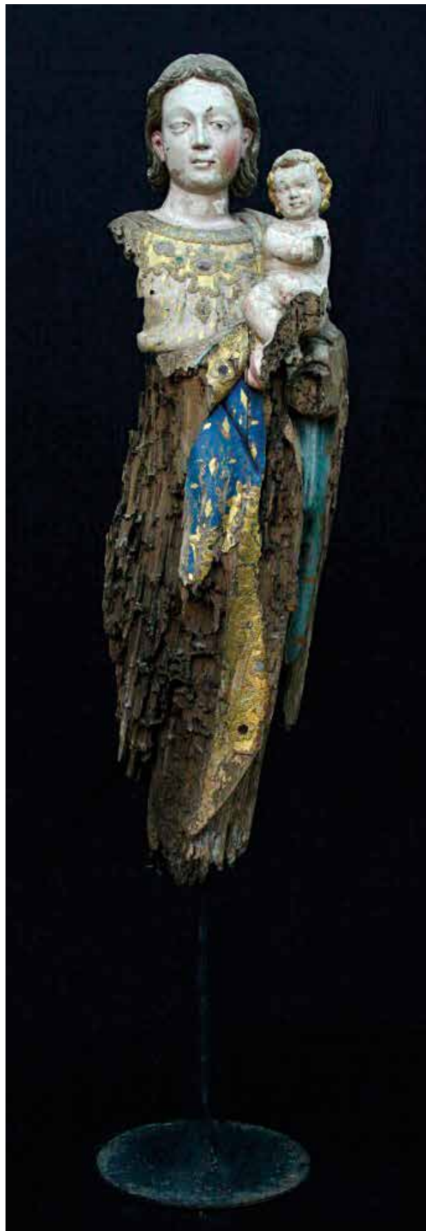
Escultura de Nossa Senhora com o Menino, da Igreja Matriz de Areias (o antes e o depois da intervenção).

Em 2015, com o apoio técnico do Laboratório de Conservação e Restauro de Pintura de Cavalete e Escultura em Madeira Policromada, do Instituto Politécnico de Tomar, e sob a coordenação da Dra. Carla Rego, começaram a ser recuperadas duas esculturas, uma proveniente da Capela de Nossa Senhora da Purificação, da Frazoeira, e outra oriunda da Igreja do Espírito Santo, Matriz de Igreja Nova do Sobral. Também durante este ano, foram devolvidas aos seus locais de origem (Igrejas de Águas Belas e de Areias) as 5 esculturas e as 5 pinturas que, ao longo de 2014, foram alvo de intervenção de conservação e restauro pelo IPT, sob o patrocínio da Fundação.