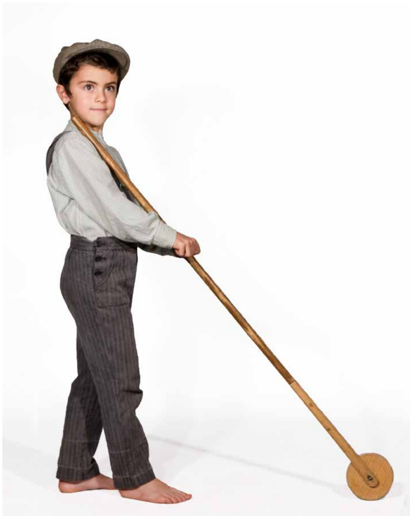
Exemplar de traje pertencente ao Rancho Folclórico do Alqueidão.