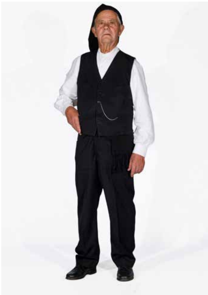
Exemplar de traje pertencente ao Rancho Folclórico do Beco.

Este projeto visa a preservação de memórias e factos que, de geração em geração, foram sendo transmitidos, muitas vezes por via oral, no concelho de Ferreira do Zêzere. Em 2015, este projeto foi enriquecido com uma nova vertente, decorrente do trabalho de recolha fotográfica de trajes tradicionais da região, pertencentes aos 3 ranchos folclóricos do concelho de Ferreira do Zêzere: Alqueidão de Santo Amaro, Beco e Pias. As 237 fotografias foram realizadas em estúdio, com a supervisão de elementos da Federação do Folclore Português.