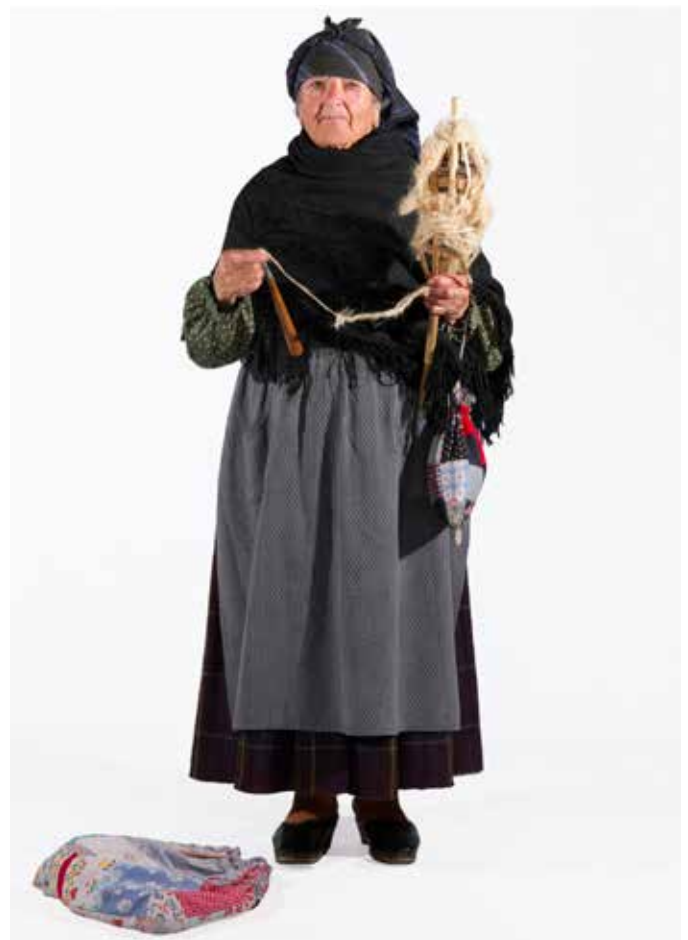
Exemplar de traje pertencente ao Rancho Folclórico de Pias.