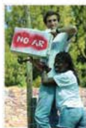
CAMPOS DE FÉRIAS