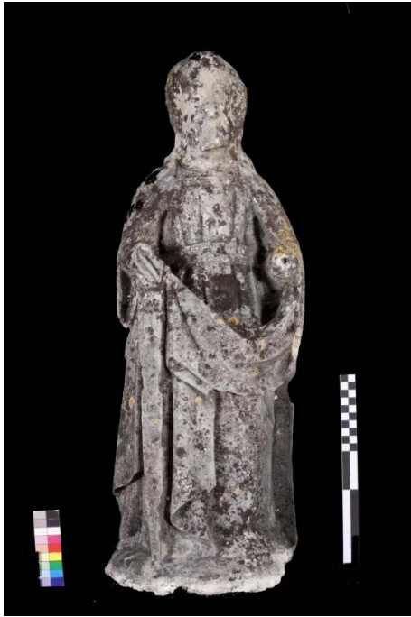
Ilustração 1 - São Joaquim frente (Antes)