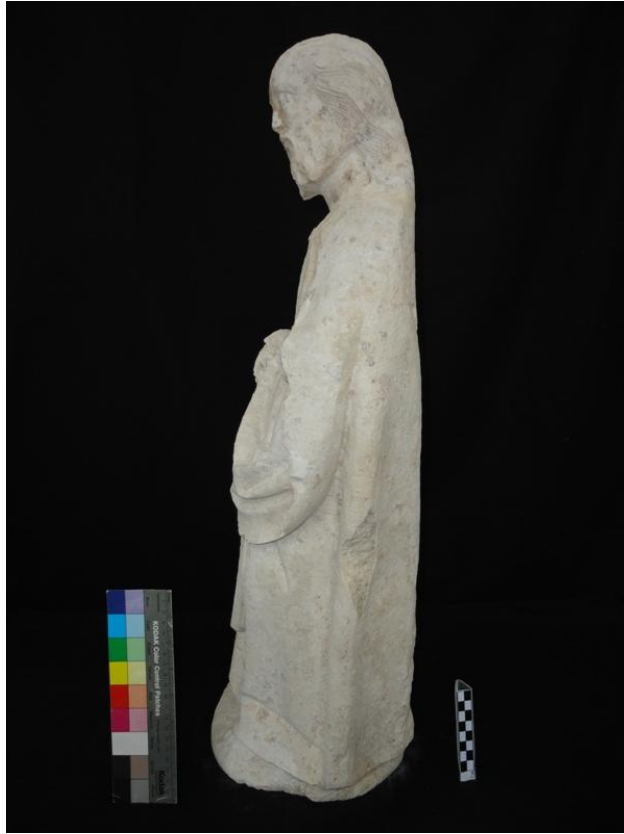
Imagem 39 - São Joaquim lateral esquerda, após intervenção