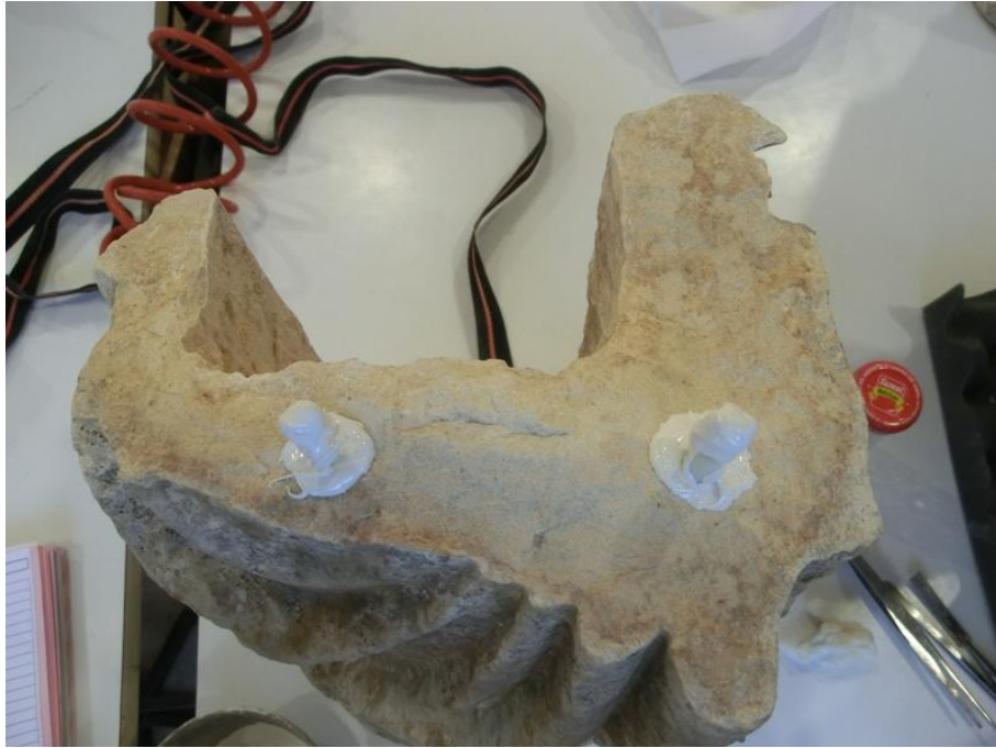
Imagem 23 - Espigões de reforço em fibra de vidro