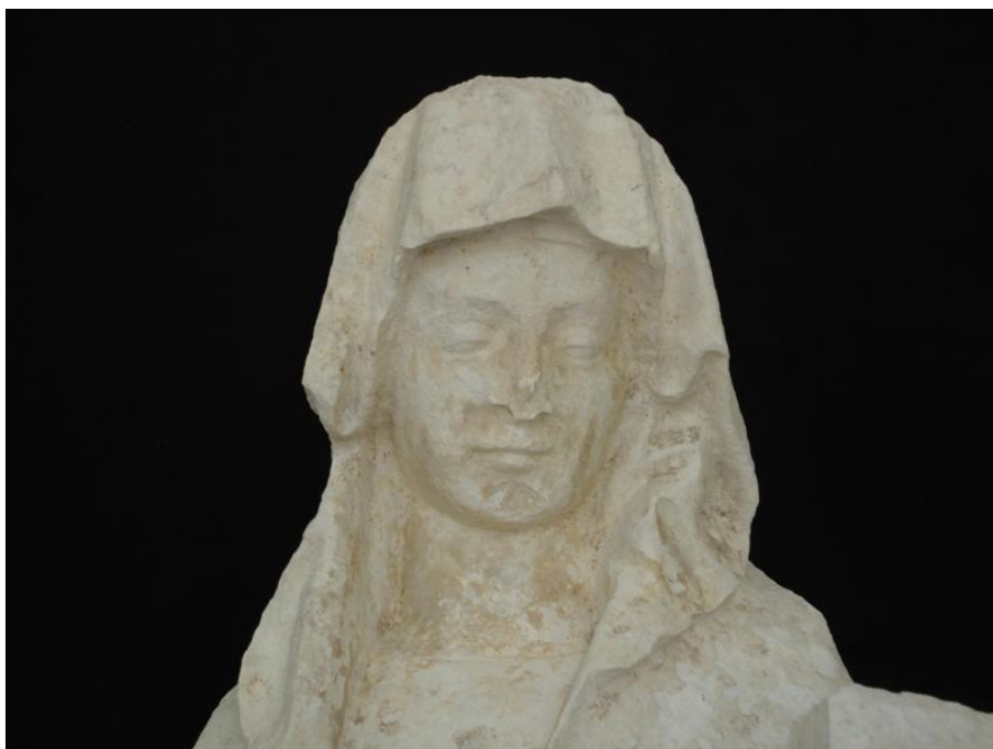
Imagem 30 - Rosto Santa Ana, após intervenção