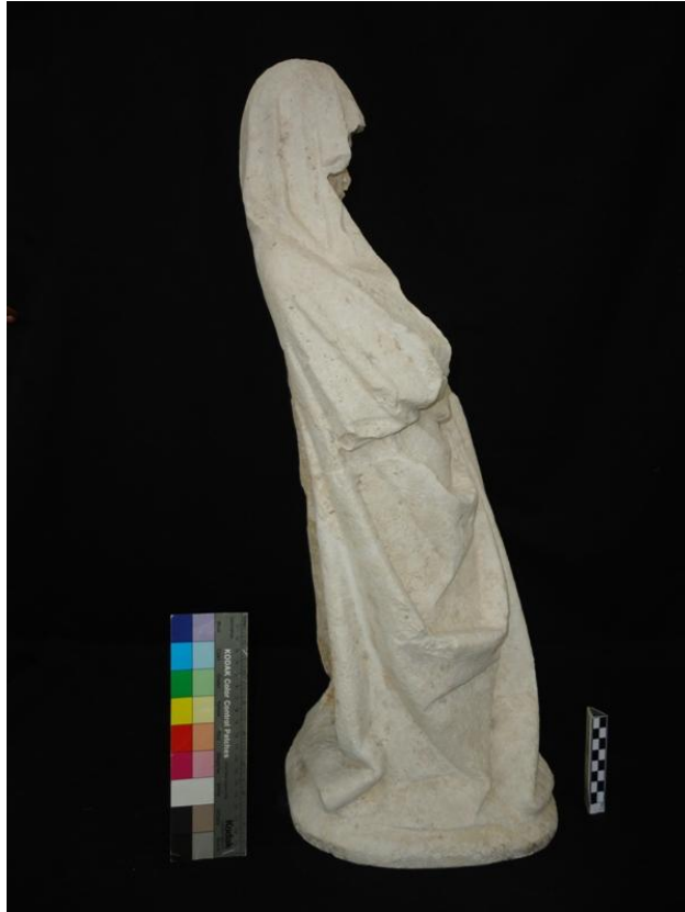
Imagem 32 - Santa Ana lateral direita, após intervenção