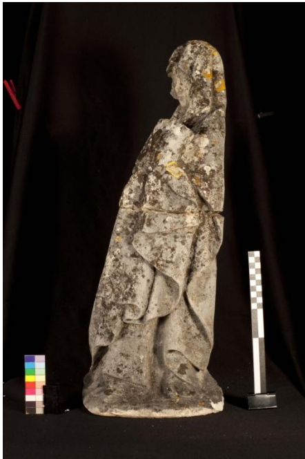
Figura 8 – Imagem feminina, vista da lateral esquerda.