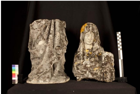
Ilustração 5 - Santa Ana frente (Antes)