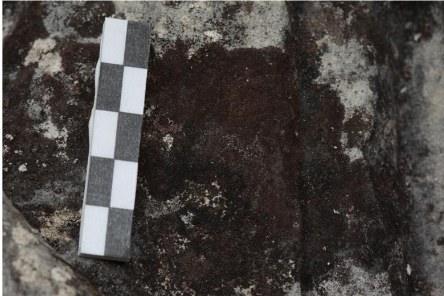
Imagem 9 - Pormenor Líquenes negros manto Santa Ana