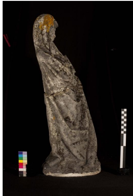
Figura 9 – Imagem feminina, vista da lateral direita.