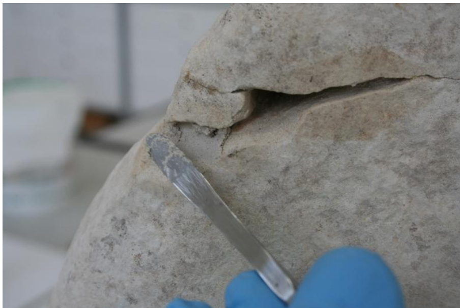
Imagem 25 - Preenchimento de Lacunas