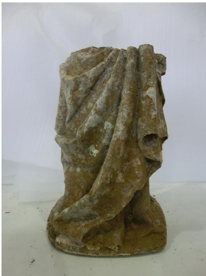
Imagem 19 - Fragmento Santa Ana, após 1ª fase de limpeza