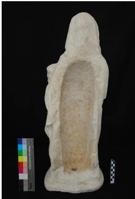
Imagem 33 - Santa Ana verso após intervenção