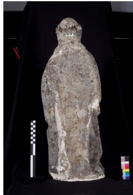
Figura 3 – Imagem masculina, verso.