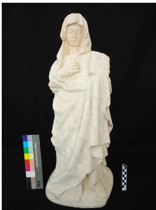
Imagem 31 - Santa Ana frente, após intervenção