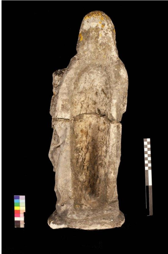
Imagem 3 - Santa Ana verso, antes da intervenção