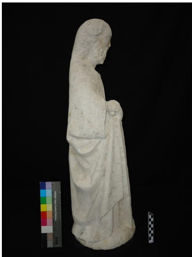
Imagem 37 - São Joaquim lateral direita, após intervenção