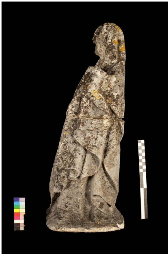
Imagem 4 - Santa Ana lateral esquerda, antes da intervenção