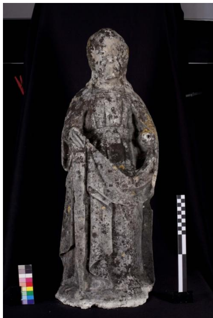
Figura 2 – Imagem masculina, anverso.