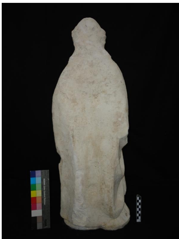
Imagem 38 - São Joaquim verso após intervenção