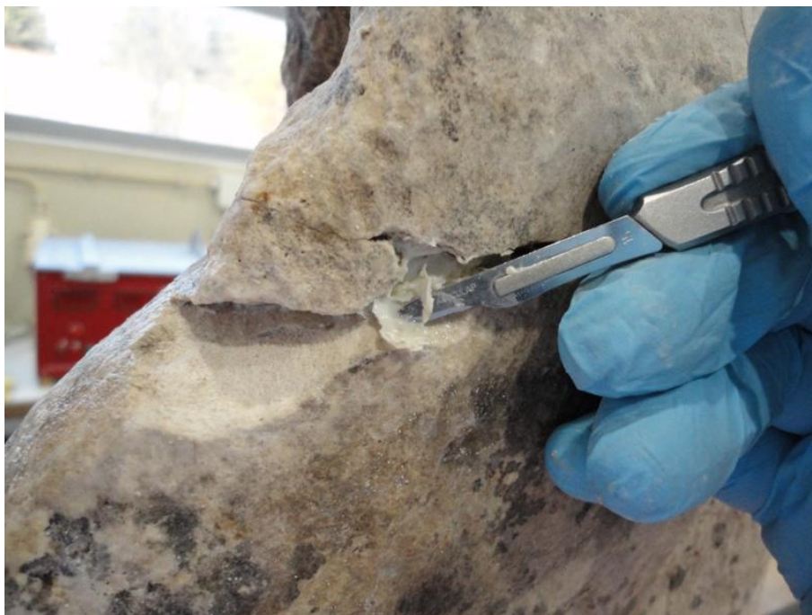
Imagem 18 - Remoção de excesso de resina usada em intervenção anterior, São Joaquim