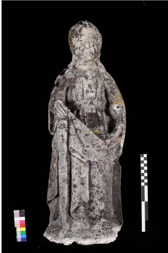
Imagem 5 - São Joaquim frente, antes da intervenção