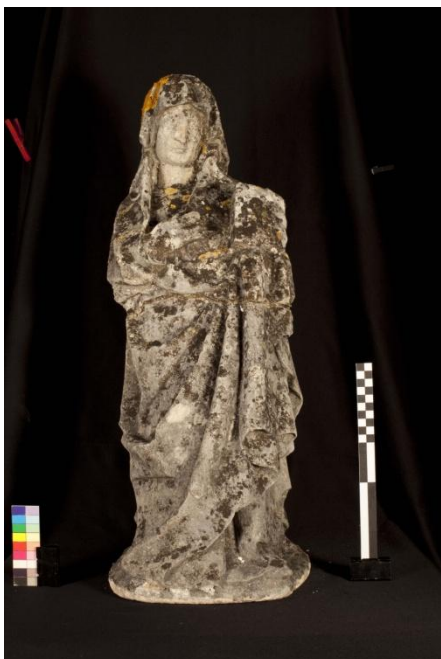
Figura 6 – Imagem feminina, anverso.