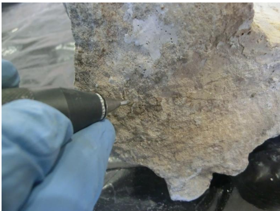
Imagem 21 - Remoção de vestígios de cimento cola, usado em intervenções anteriores, com micro-martelo ultrassónico