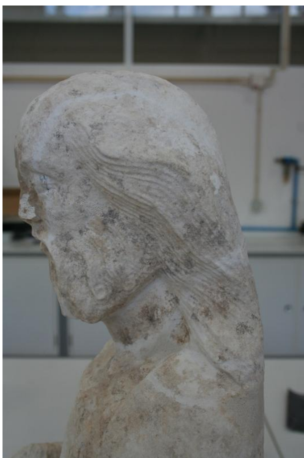
Imagem 27 - Aspeto da cabeça de São Joaquim após preenchimento de lacunas e fissuras (lateral esquerda)