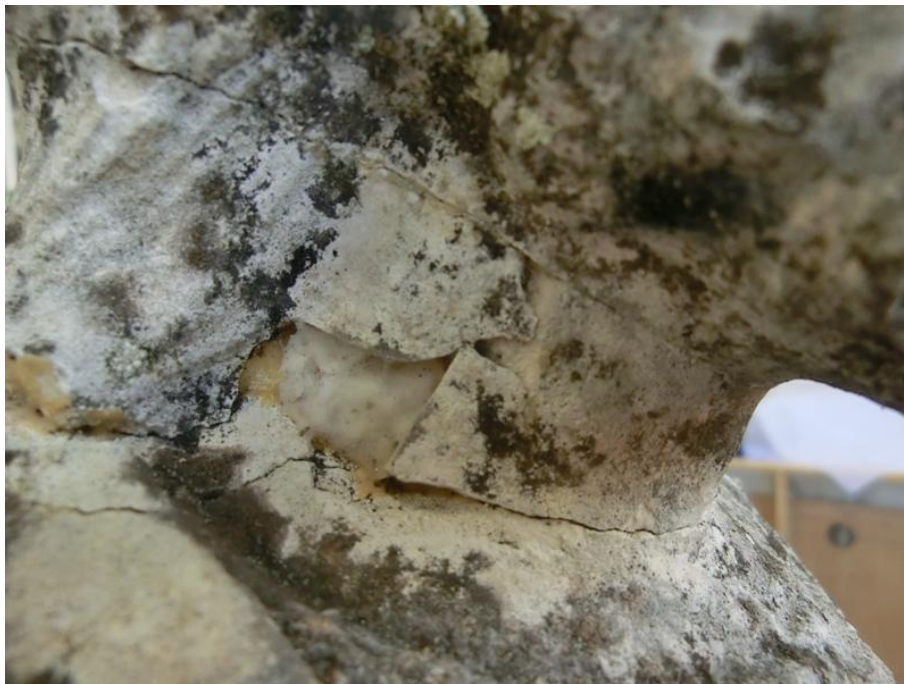
Imagem 12 - Pormenor antiga colagem do pescoço, vestígios de resina