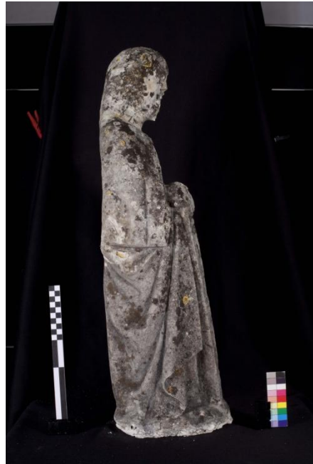
Figura 5 – Imagem masculina, vista da lateral direita.