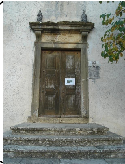
Figura 1 – Igreja Paroquial de Nossa Senhora do Pranto e pormenor da porta onde se encontram as imagens.