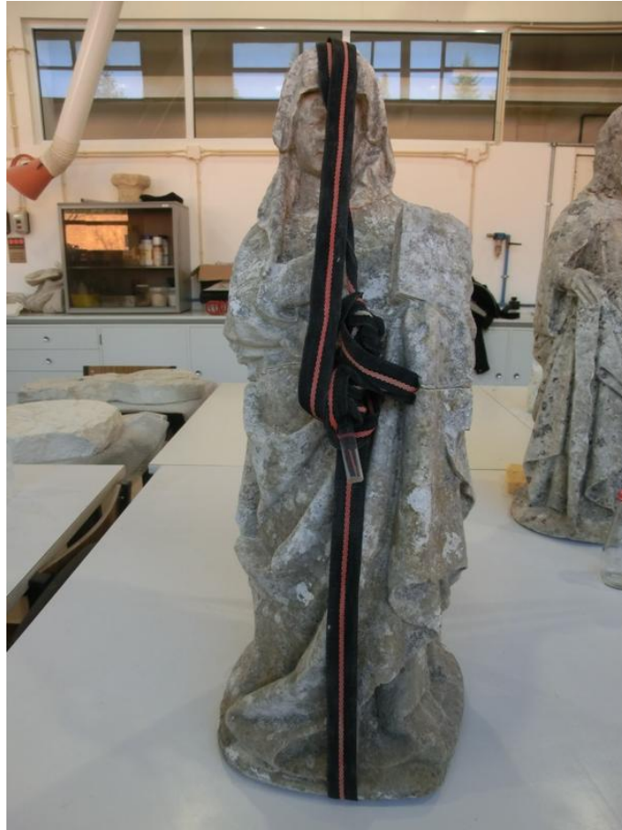
Imagem 24 - Santa Ana durante processo de colagem