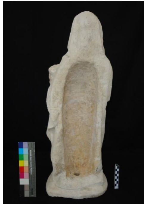
Ilustração 8 - Santa Ana verso (Depois)