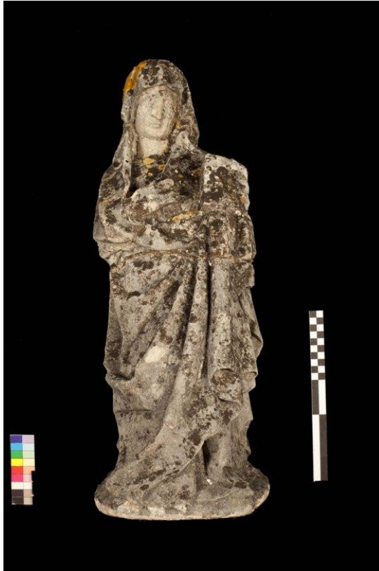
Imagem 1 - Santa Ana frente, antes da intervenção