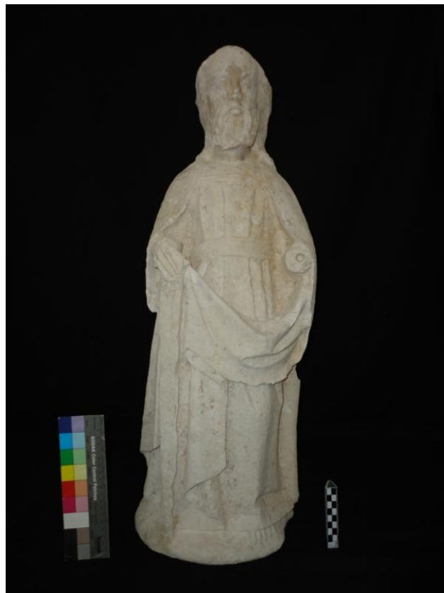
Imagem 36 - São Joaquim frente, após intervenção