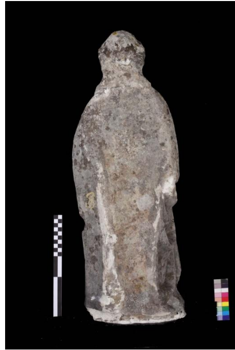
Ilustração 2 - São Joaquim verso (Antes)