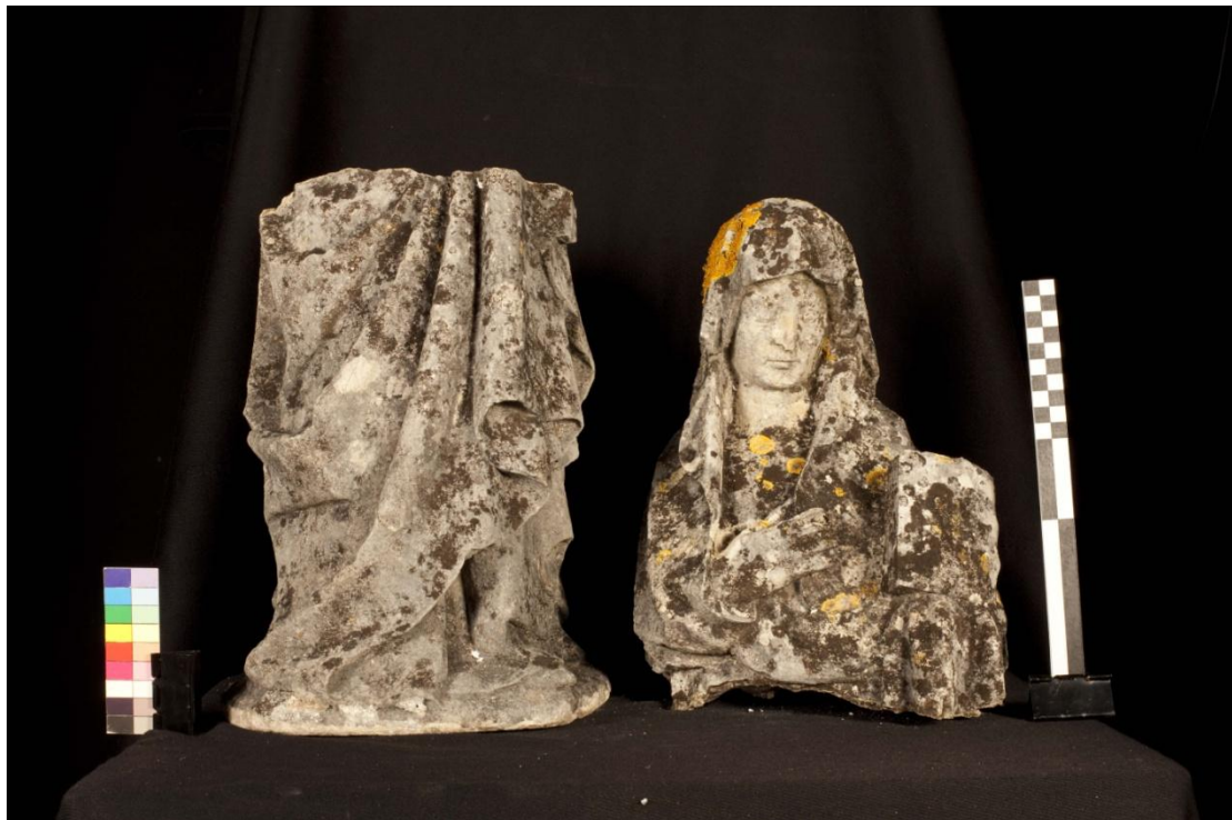
Figura 10 – Imagem feminina, facturada.