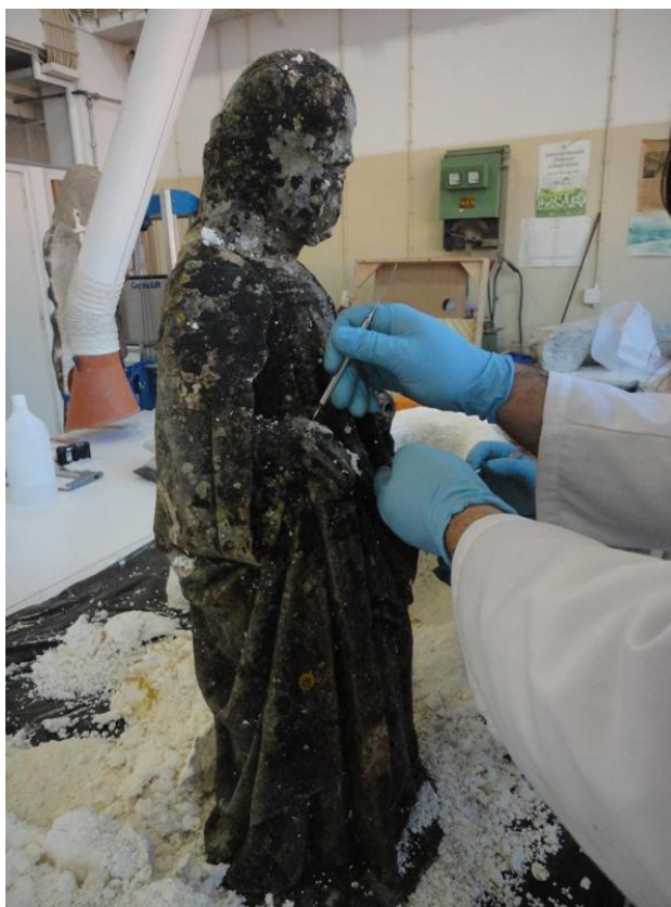
Imagem 15 - Remoção da pasta de pepel com biocida, São Joaquim