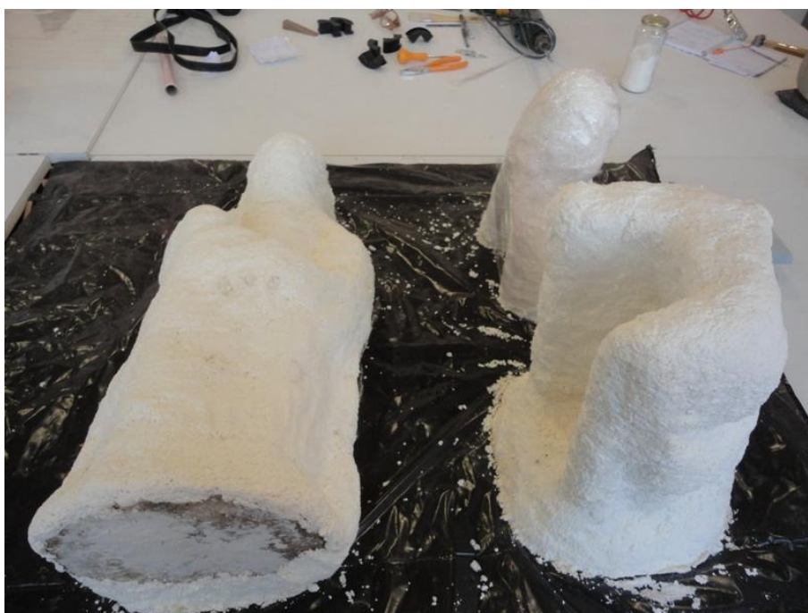
Imagem 14 - Aplicação de biocida com pasta de papel