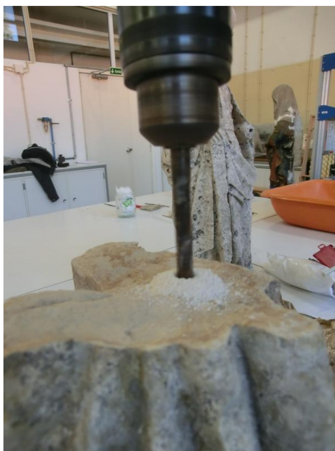
Imagem 22 - Perfuração para aplicação de espigão de reforço