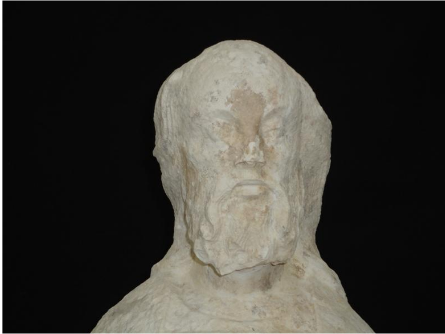
Imagem 35 - São Joaquim rosto, após intervenção