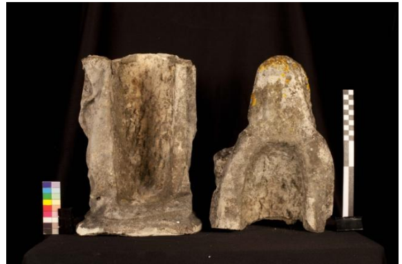
Ilustração 6 - Santa Ana verso (Antes)