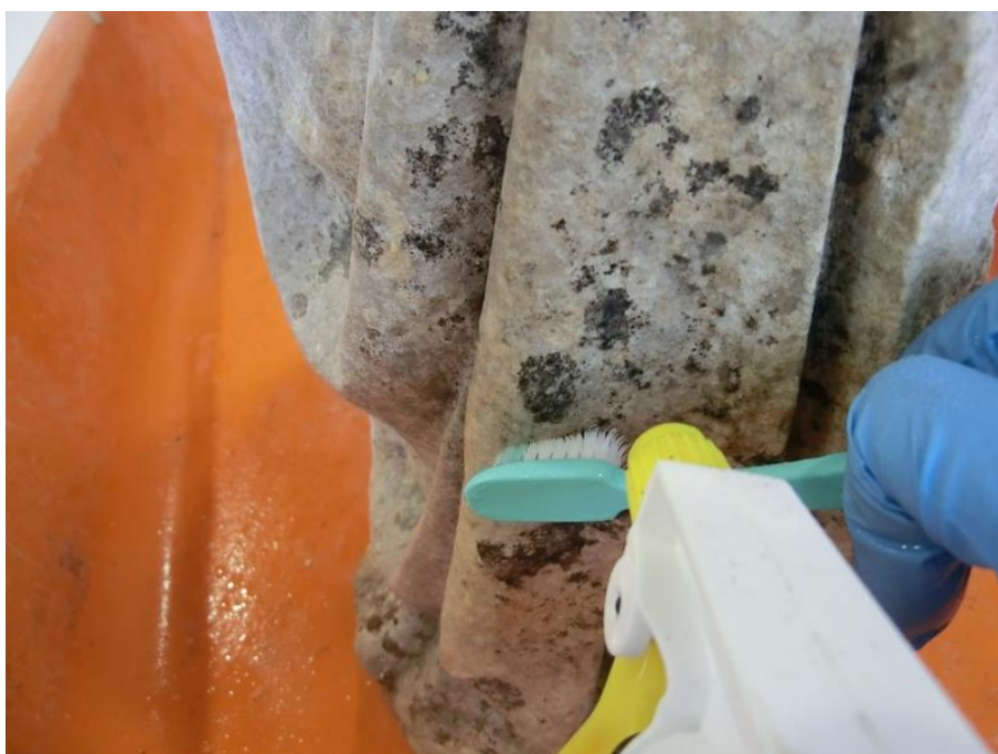
Imagem 20 - Fase Final, Remoção de Microrganismos por Pulverização e Escovagem