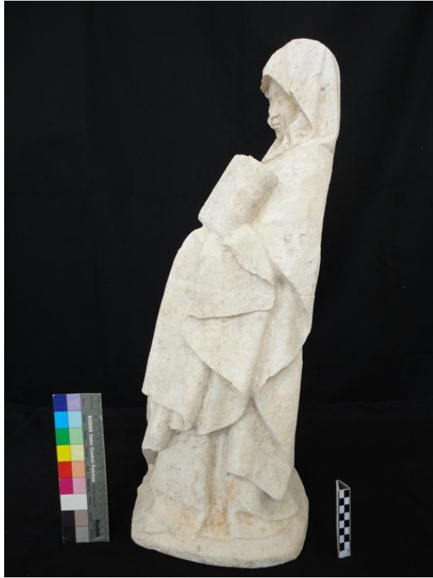
Imagem 34 - Santa Ana lateral esquerda, após intervenção