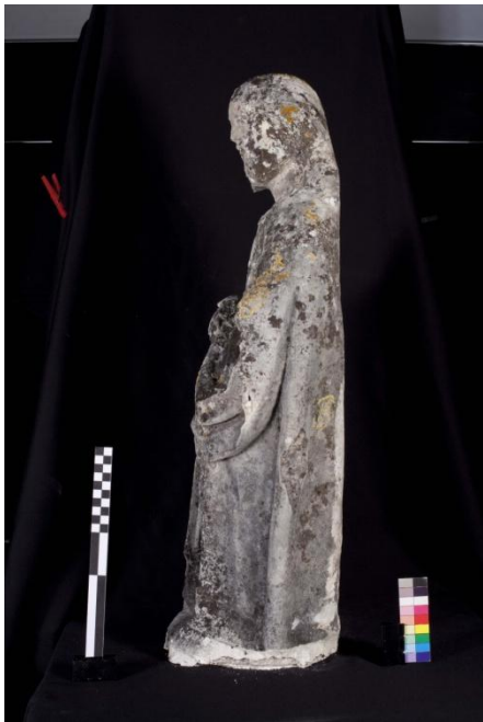
Figura 4 – Imagem masculina, vista da lateral esquerda.