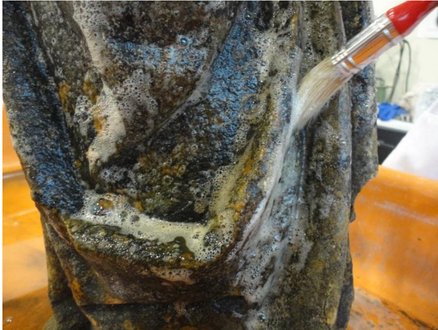
Imagem 17 - Aplicação de Biocida com pincel