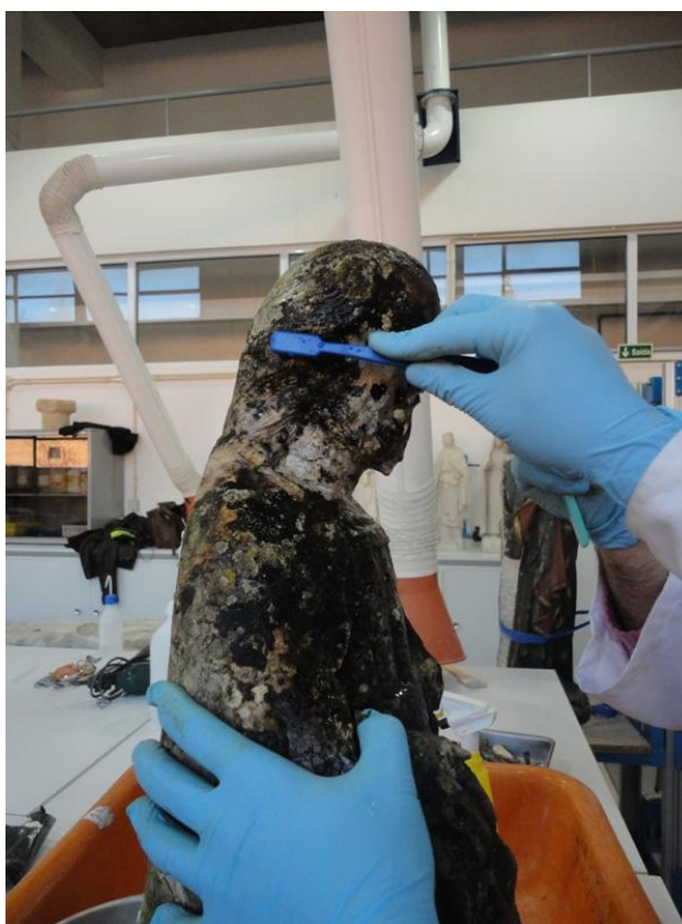
Imagem 16 - Início da remoção dos microrganismos, pulverização e escovagem, São Joaquim