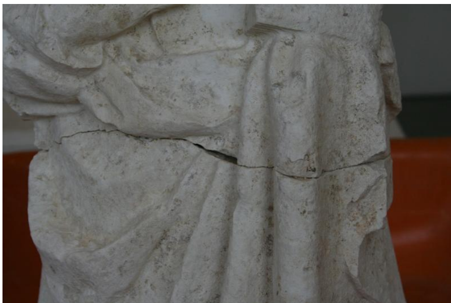
Imagem 28 - Pormenor da Santa Ana, antes do preenchimento de lacunas e fissuras