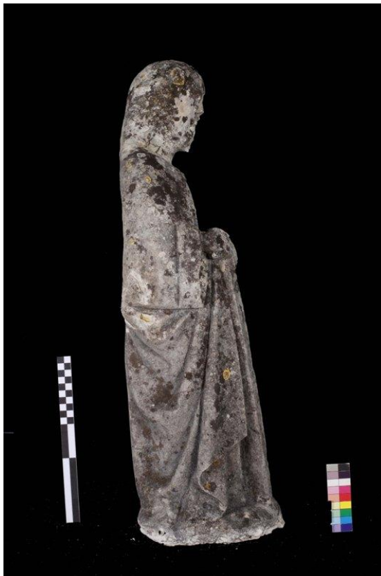
Imagem 6 - São Joaquim lateral direita, antes da intervenção