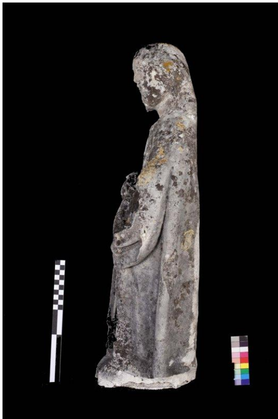
Imagem 8 - São Joaquim lateral esquerda, antes da intervenção