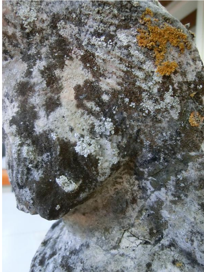
Imagem 11 - Colonização biológica intensa, cabeça de São Joaquim