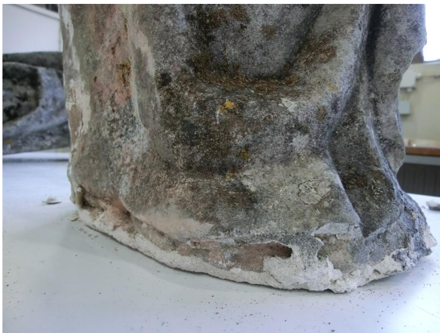
Imagem 13 - Vestígios de argamassa na base da imagem de São Joaquim