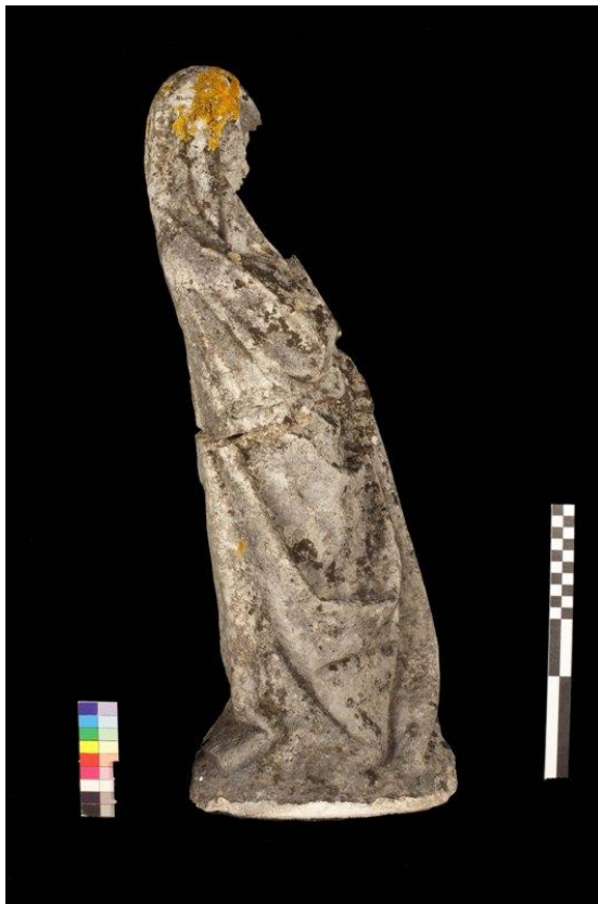
Imagem 2 - Santa Ana lateral direita, antes da intervenção