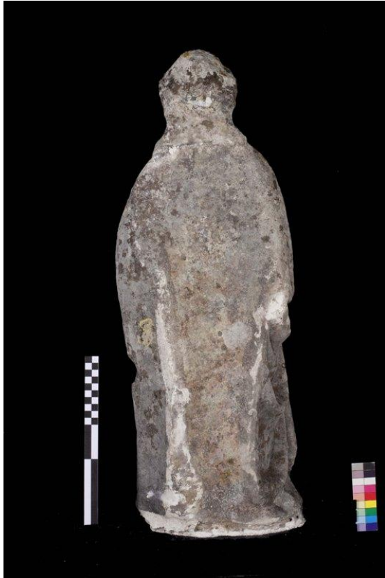
Imagem 7 - São Joaquim verso, antes da intervenção