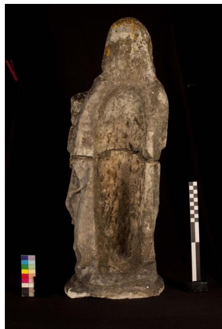
Figura 7 – Imagem feminina, verso.