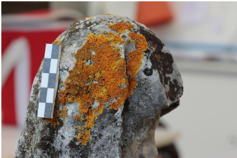
Imagem 10 - Pormenor de colonização biológica intensa cabeça de Santa Ana